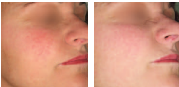
Couperose Traitée avec le Laser Nd:YAG (photos prises en utilisant la lumière polarisée)

Avec le Synchro FT, votre médecin possède une plate-forme complète avec laquelle il va pouvoir répondre à toutes vos demandes d'épilation, quelque soit votre couleur de peau ou encore l'endroit et les surfaces à traiter.