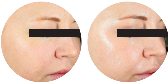
Traitement Cool Peel